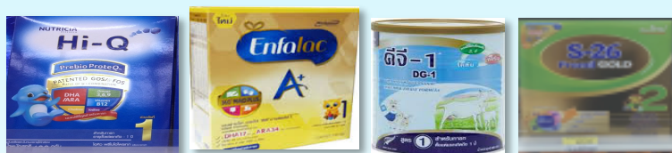
นมผง สูตร 1 และ 2