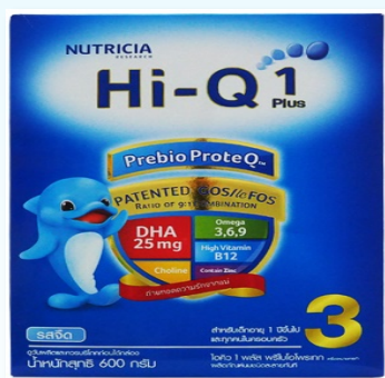
นมผง สูตร 3

ผลิตภัณฑ์ ที่ไม่ถูกควบคุม ภายใต้นิยามตาม พ.ร.บ.