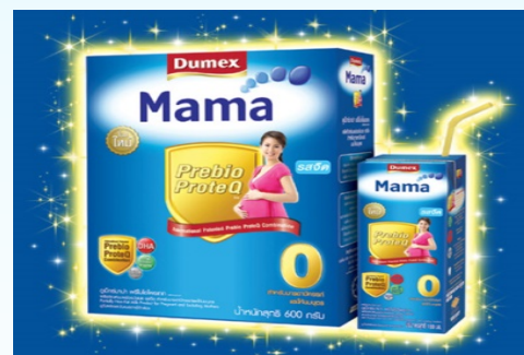
นมสำหรับหญิงตั้งครรภ์ และหญิงให้นมบุตร