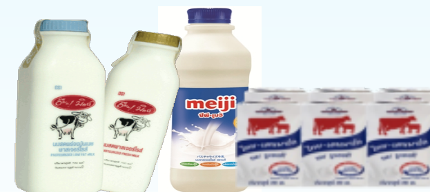
นมโค, นมสด, นมพาสเจอร์ไรต์, นม UHT