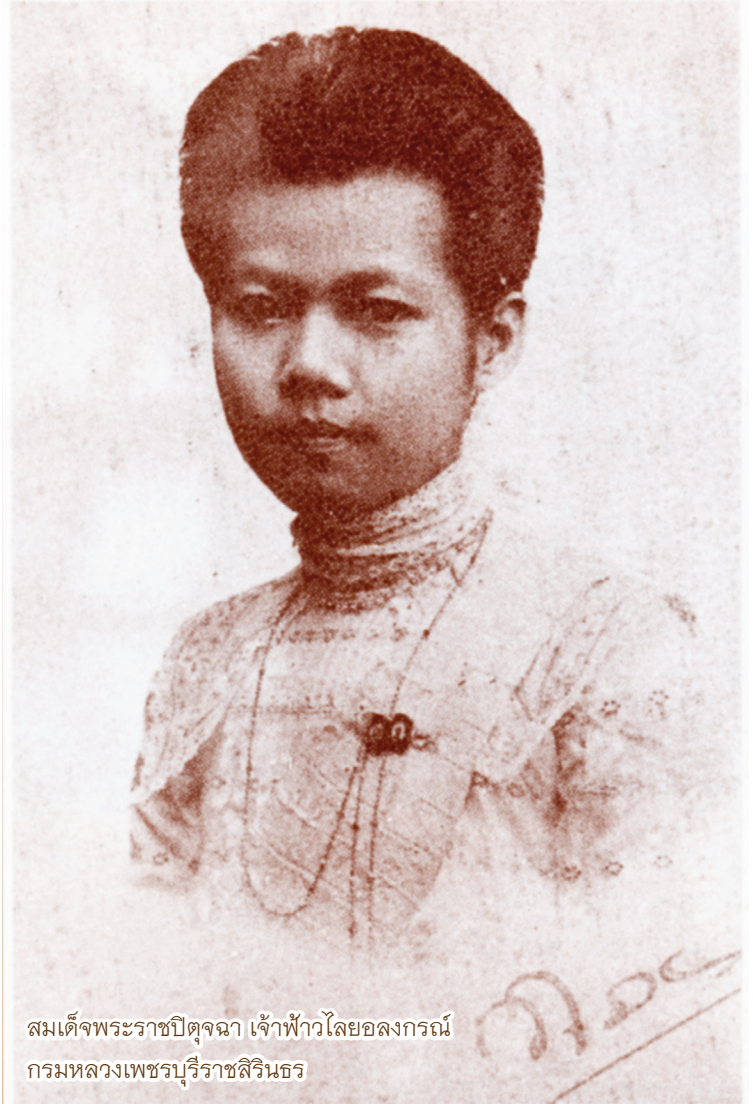
สมเด็จพระราชปิตุจฉา เจ้าฟ้าวไลยอลงกรณ์ กรมหลวงเพชรบุรีราชสิรินธร