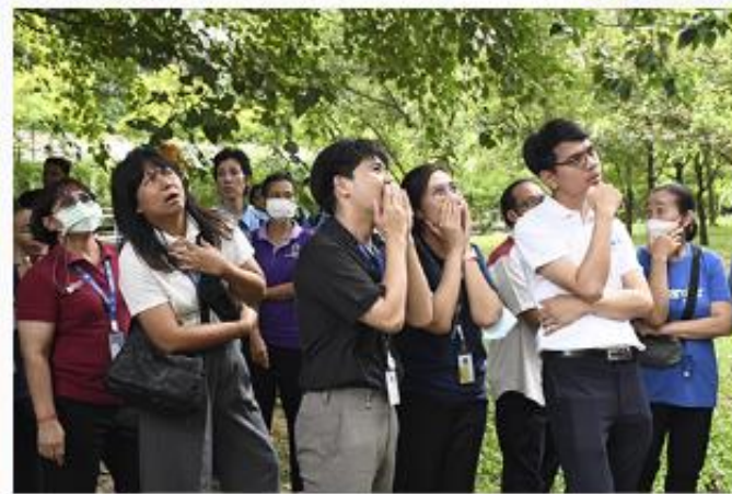
การอบรมเชิงปฏิบัติการ “การซ้อมดับเพลิงและฝึกซ้อมอพยพหนีไฟ” คณะพยาบาลศาสตร์ ศาลายา