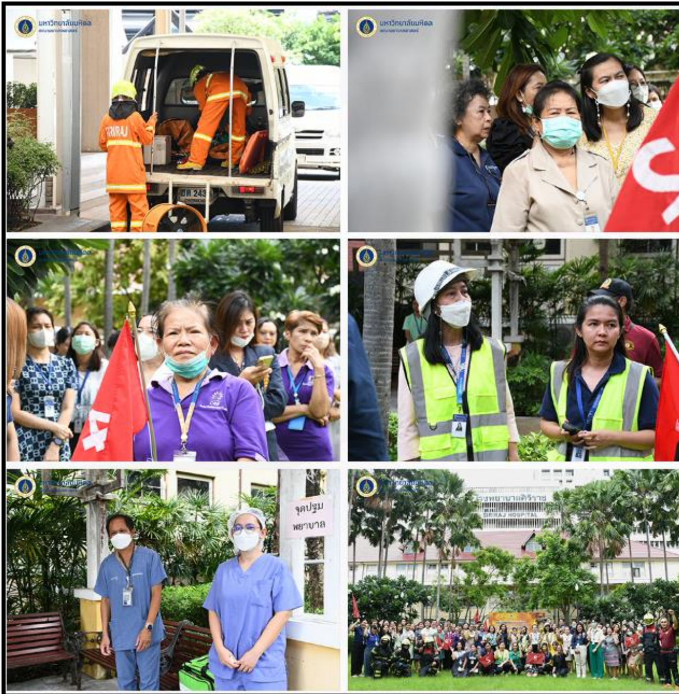
การซ้อมดับเพลิงและฝึกซ้อมอพยพหนีไฟ คณะพยาบาลศาสตร์ บางกอกน้อย