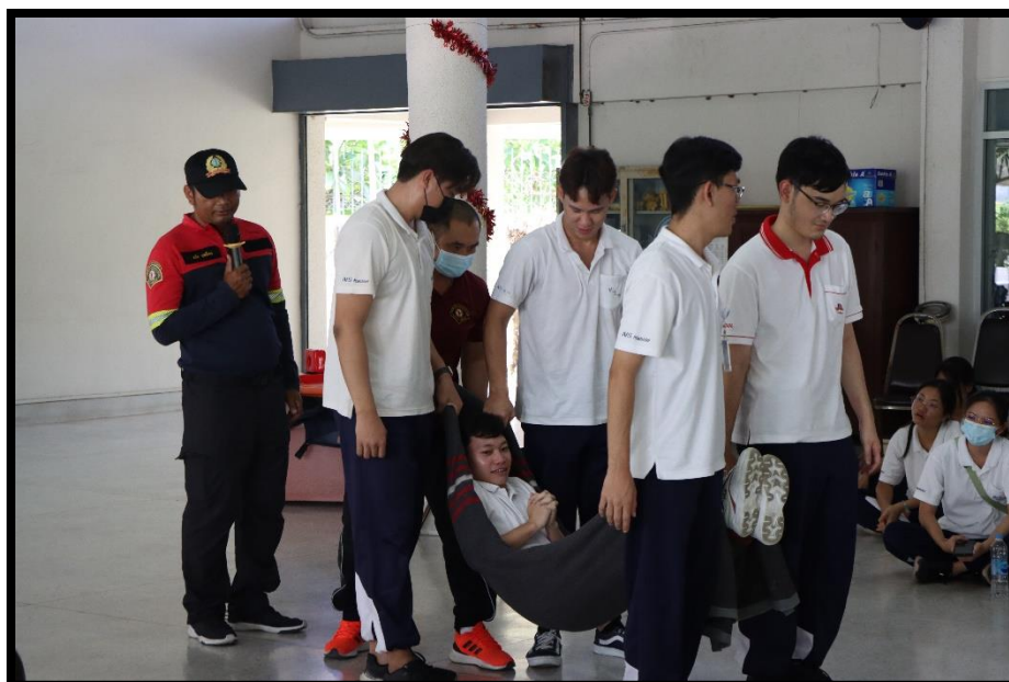
การอบรมเชิงปฏิบัติการ “การซ้อมดับเพลิงและฝึกซ้อมอพยพหนีไฟ” หอพักคณะพยาบาลศาสตร์ บางขุนนนท์