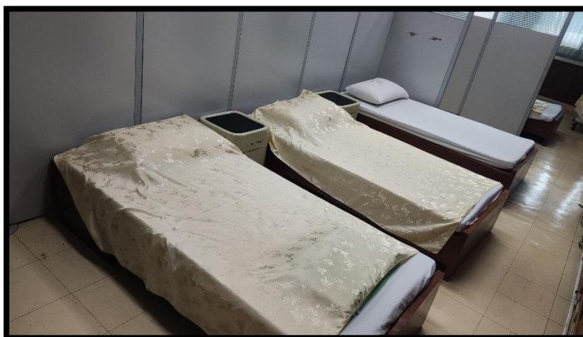
ห้องปฐมพยาบาล คณะพยาบาลศาสตร์ บางกอกน้อย