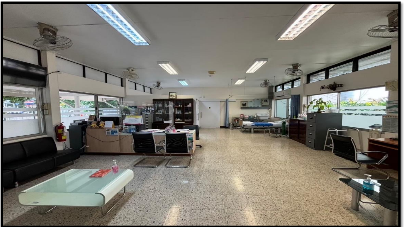
คลินิกการพยาบาลและการผดุงครรภ์ คณะพยาบาลศาสตร์ หอพักบางขุนนนท์