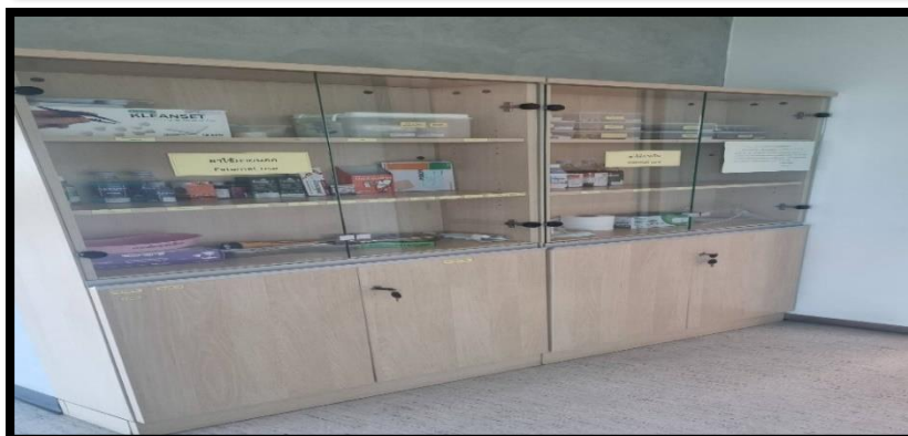
ห้องปฐมพยาบาล คณะพยาบาลศาสตร์ ศาลายา