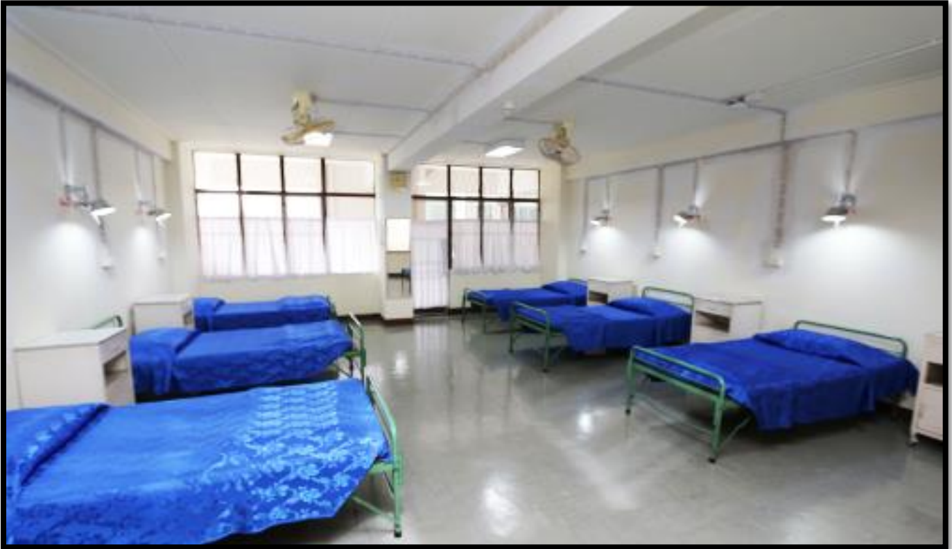
ห้องปฐมพยาบาล คณะพยาบาลศาสตร์ หอพักบางขุนนนท์