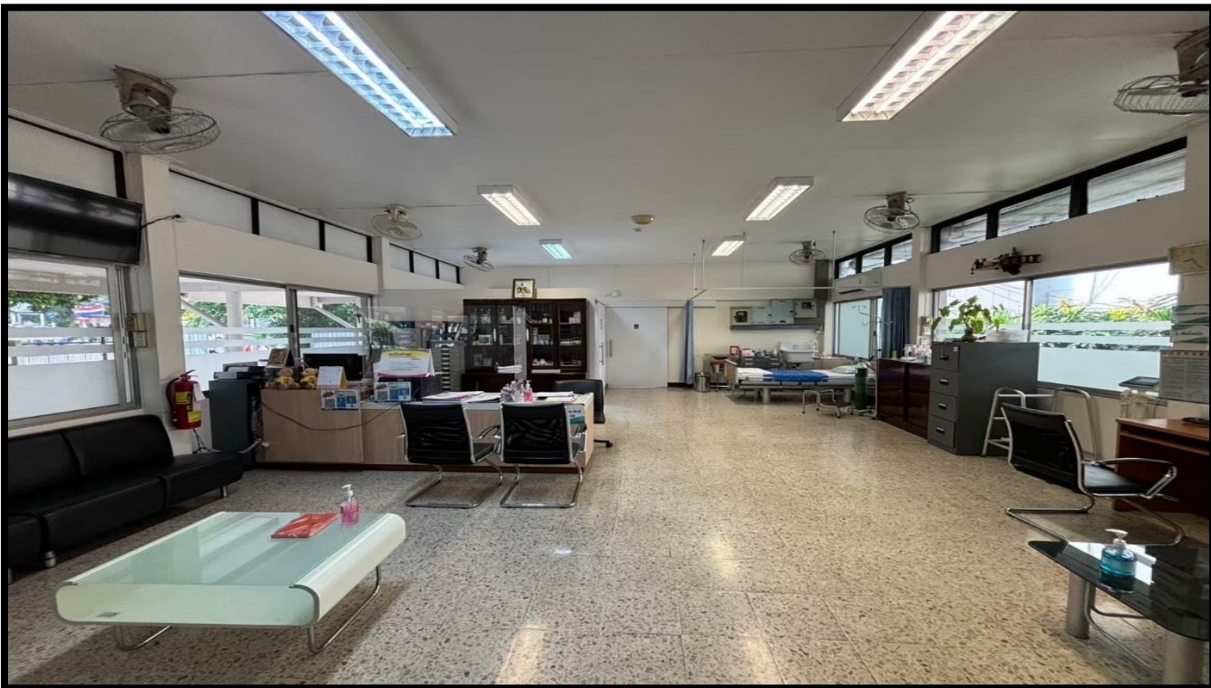
คลินิกการพยาบาลและการผดุงครรภ์ คณะพยาบาลศาสตร์ หอพักบางขุนนนท์