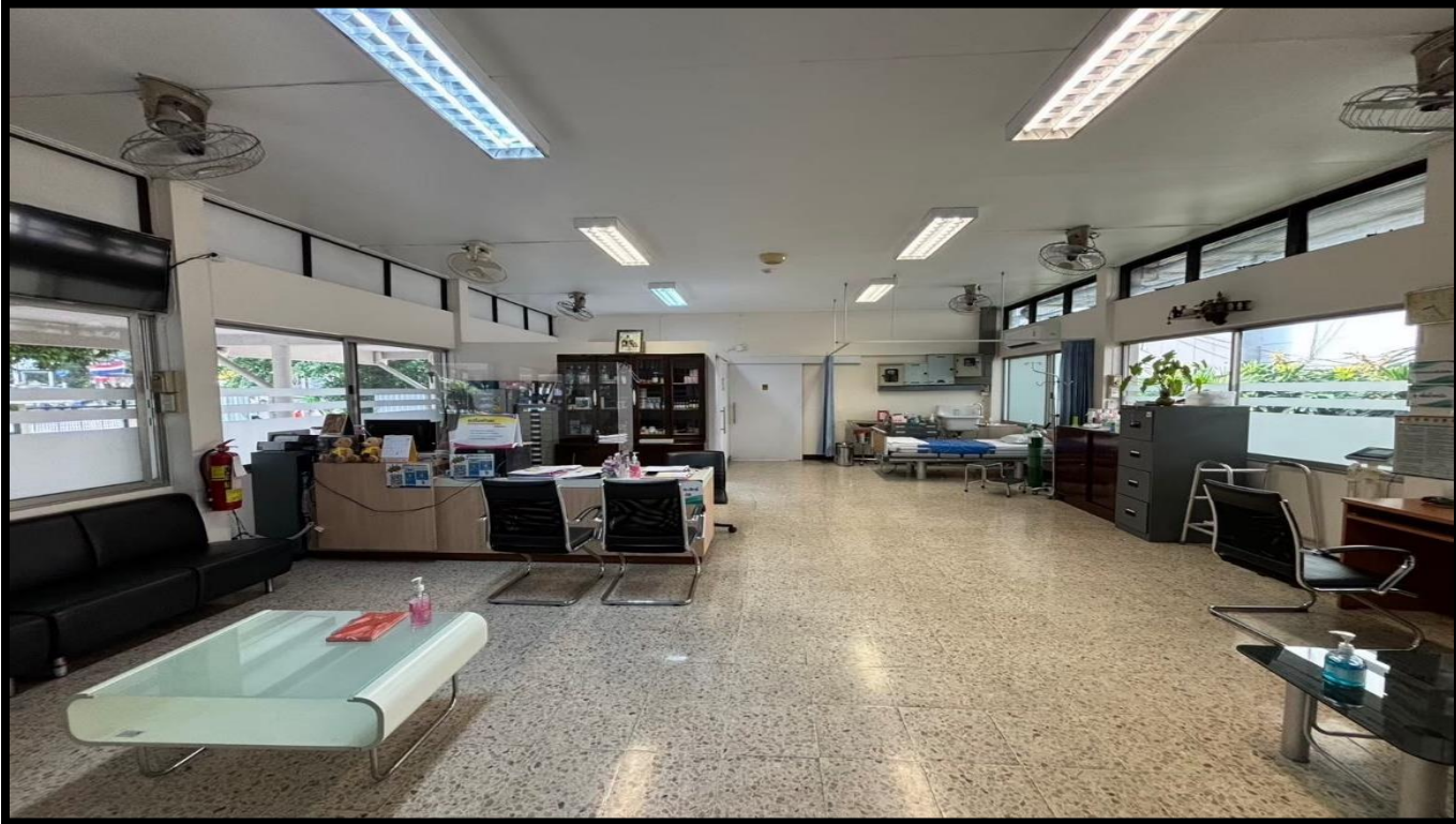
คลินิกการพยาบาลและการผดุงครรภ์ คณะพยาบาลศาสตร์ หอพักบางขุนนนท์